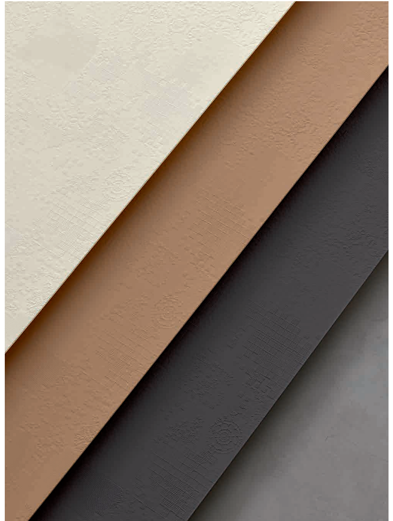
Gesso, Avana, Grafite