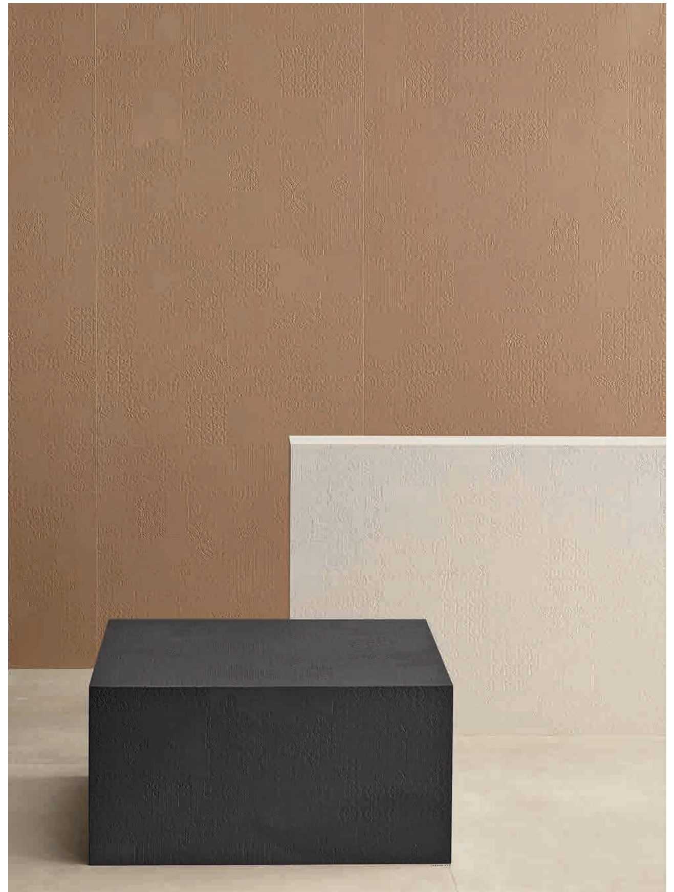
This page: Avana, Gesso, Grafite. Opposite page: Gesso.