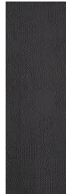
Déchirer XL Grafite * 100-300 cm * 39"-118"