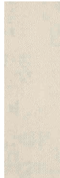
Déchirer XL Gesso * 100-300 cm * 39"-118"

Modello depositato piastrelle n° 001615790-001 – data di deposito: 25/09/2009 Registered design n° 001615790-001 – date of registration: 25/09/2009 Modello depositato piastrelle n° 001615774-001 – data di deposito: 25/09/2009 Registered design n° 001615774-001 – date of registration: 25/09/2009