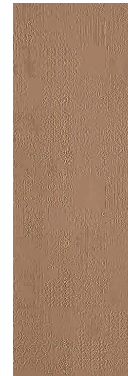
Déchirer XL Avana * 100-300 cm * 39"-118"